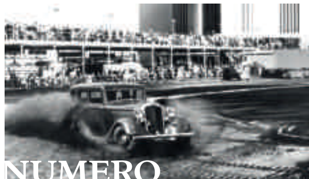
Una Dodge Sedan del 1933 alla fiera Mondiale di Chicago.